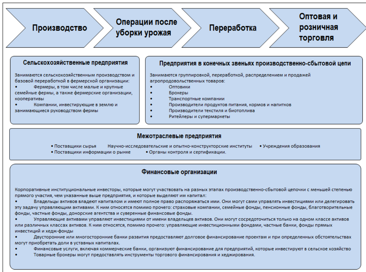
Рисунок 1.1. Различные этапы производственно-сбытовых цепей в секторе сельского хозяйства и задействованные предприятия

Примечание: Данная схема приведена только для ознакомления и не является детальным описанием