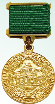
Высшая награда УО «ГГАУ» «За заслуги перед университетом»