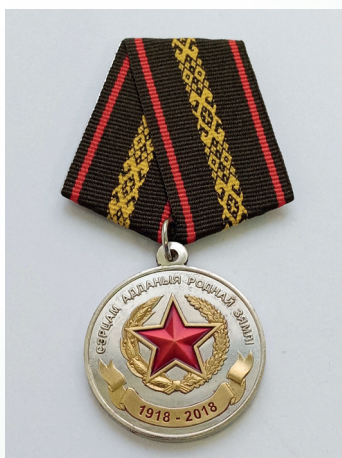
Медаль «100 лет вооружённым силам Республики Беларусь»