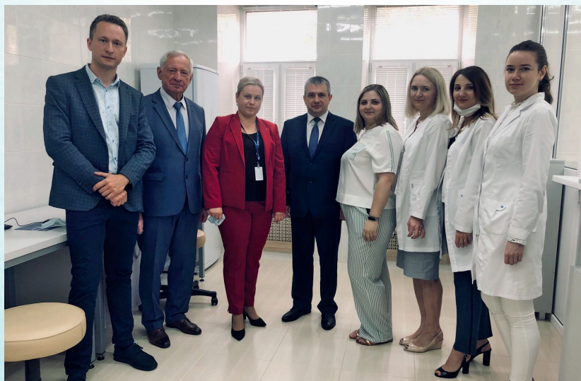
Посещение отраслевой НИЛ «ДНК-технологий» УО «ГГАУ» министром МСХиП Республики Беларусь И.И. Крупко (в центре, 2021 г.)