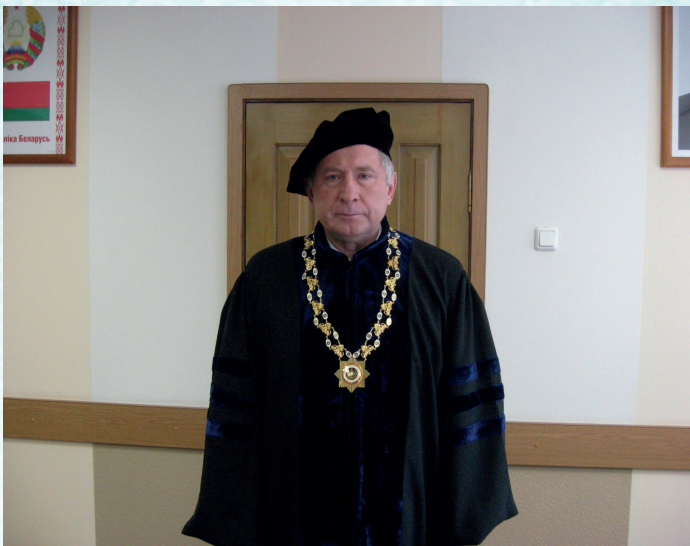
Почетный доктор Венского университета (Австрия, 2008 г.)