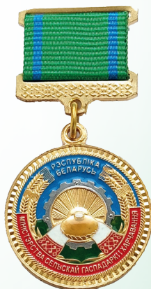
Нагрудный знак «За заслуги в сельском хозяйстве»