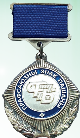
Знак Почёта Федерации профсоюзов Беларуси