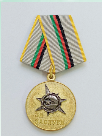
Медаль «За заслуги» Белорусского союза ветера- нов войны в Афганистане