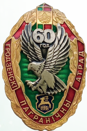
Нагрудный знак «60 лет Гродненскому погранотряду»