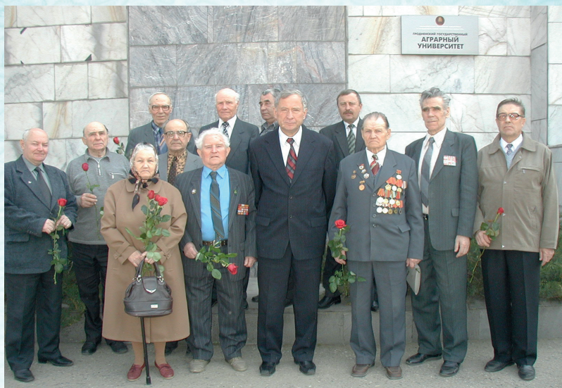
Встреча и чествование ветеранов Великой Отечественной войны и воинов-интернационалистов (2004 г.)