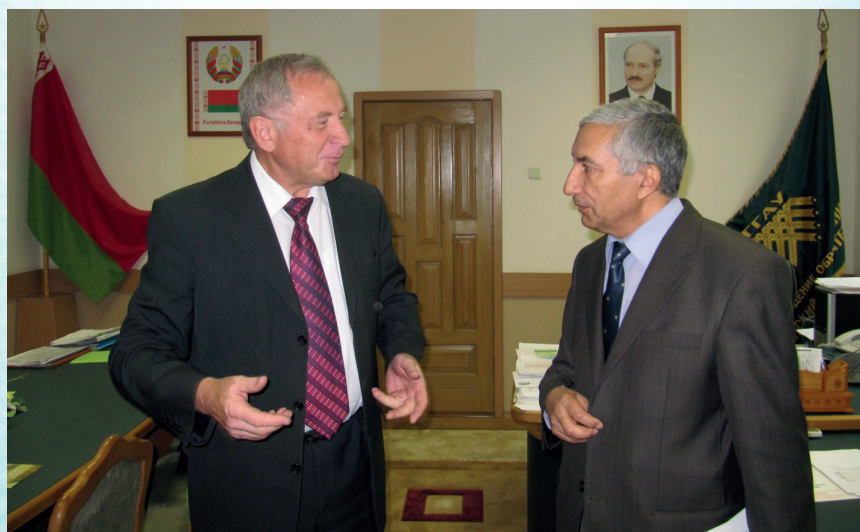
Беседа с представителем Ирана (2018 г.)