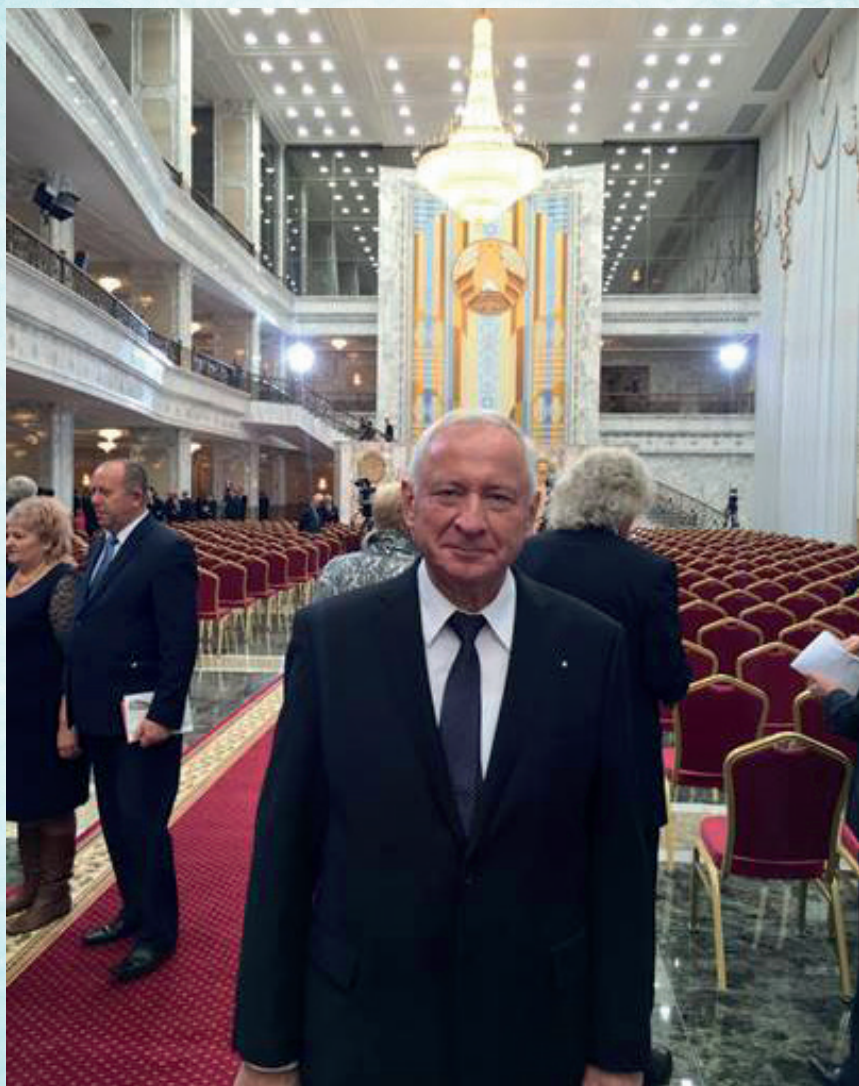
Во Дворце Независимости, 2015 г.