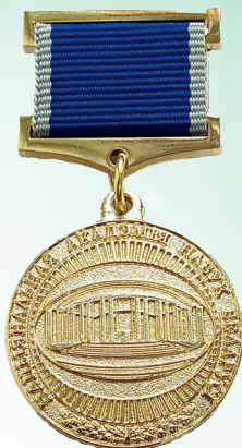
Нагрудный знак НАН Беларуси