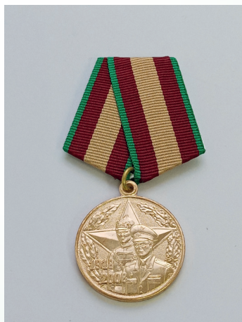
Медаль «90 лет вооружённым силам Республики Беларусь»