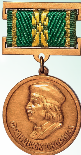
Медаль Франциска Скорины