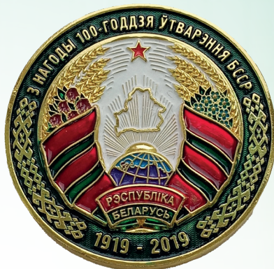
Наградная медаль «100 лет образования БССР»