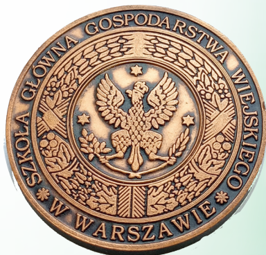
Наградная медаль Главной Сельскохозяйственной Школы в Варшаве (Польша)