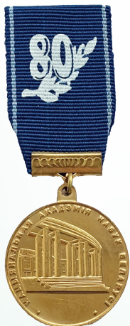
Нагрудный знак «80 лет НАН Беларуси»