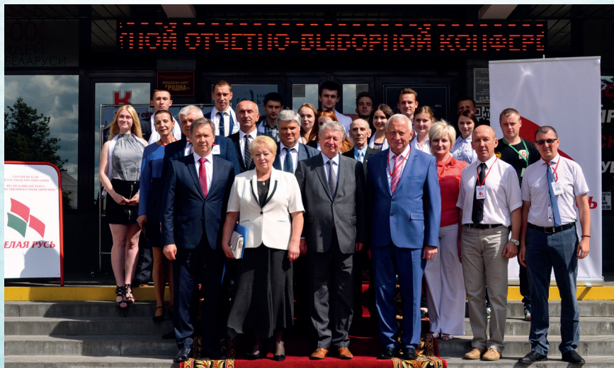
Участники отчётно-выборной конференции Гродненской областной организации РОО «Белая Русь» (2017 г.)