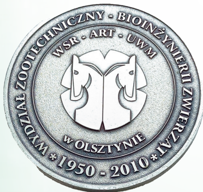
Наградная медаль университета г. Ольштын (Польша)