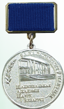
Серебряная медаль НАН Беларуси «За достижения в науке»