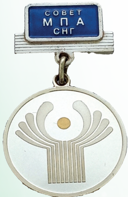
Член Совета Межпарламентской Ассамблеи стран- участников СНГ