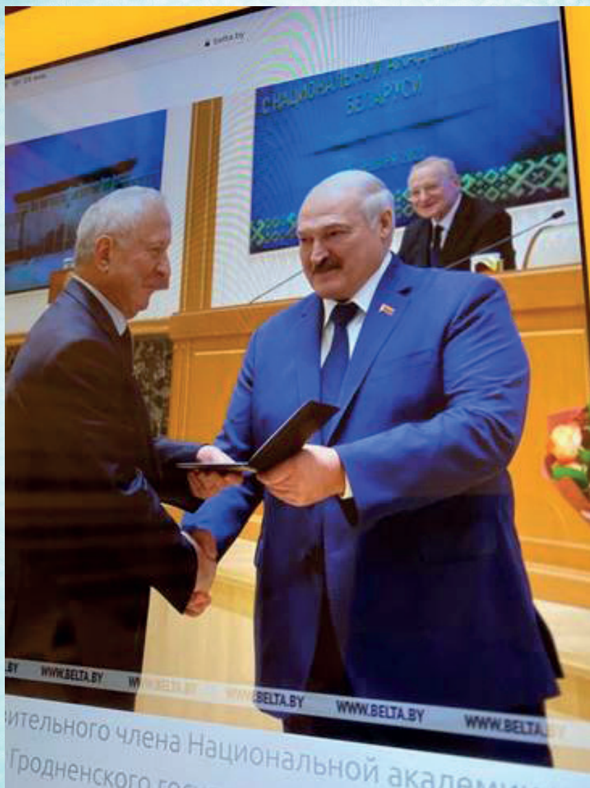
Вручение В.К. Пестусу звания Академика НАН Беларуси Президентом страны А.Г. Лукашенко (2021 г.)