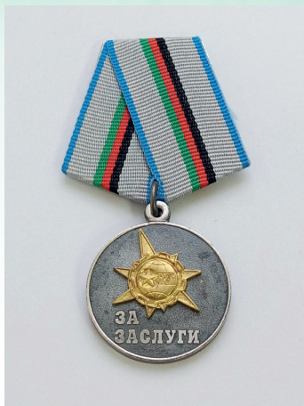
Медаль «За заслуги» Белорусского союза ветера- нов войны в Афганистане