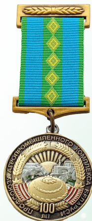
Нагрудный знак «100 лет профсоюзу АПК Беларуси»