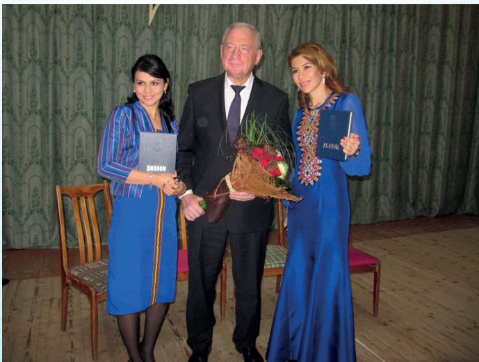
Вручение дипломов иностранным студентам УО «ГГАУ»