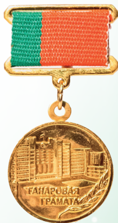
Почётная Грамота Национального собрания Республики Беларусь