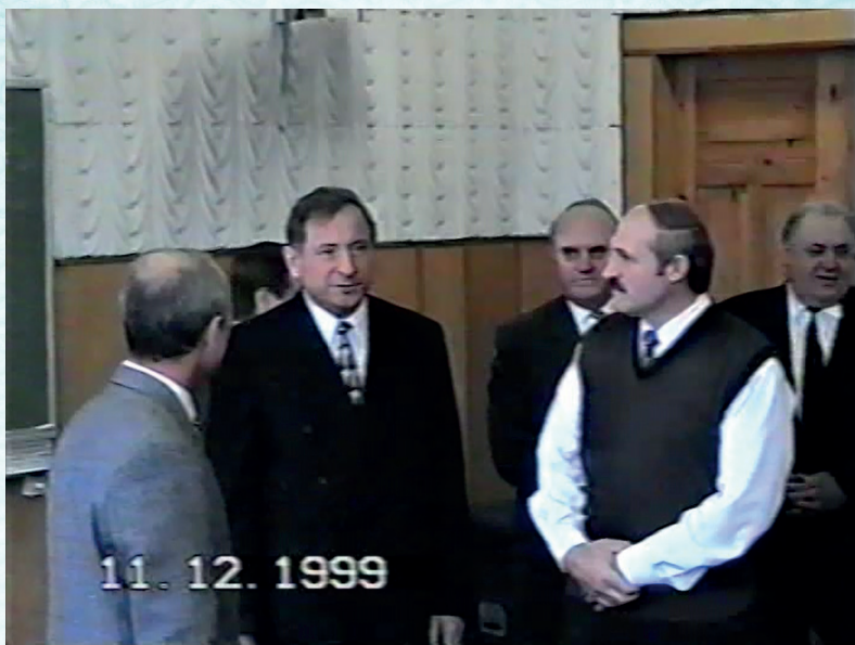
Визит Президента Республики Беларусь А.Г. Лукашенко в ГСХИ (11.12.1999 г.)