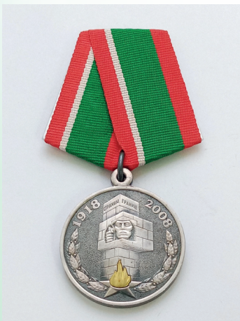
Медаль «90 лет на страже границы»