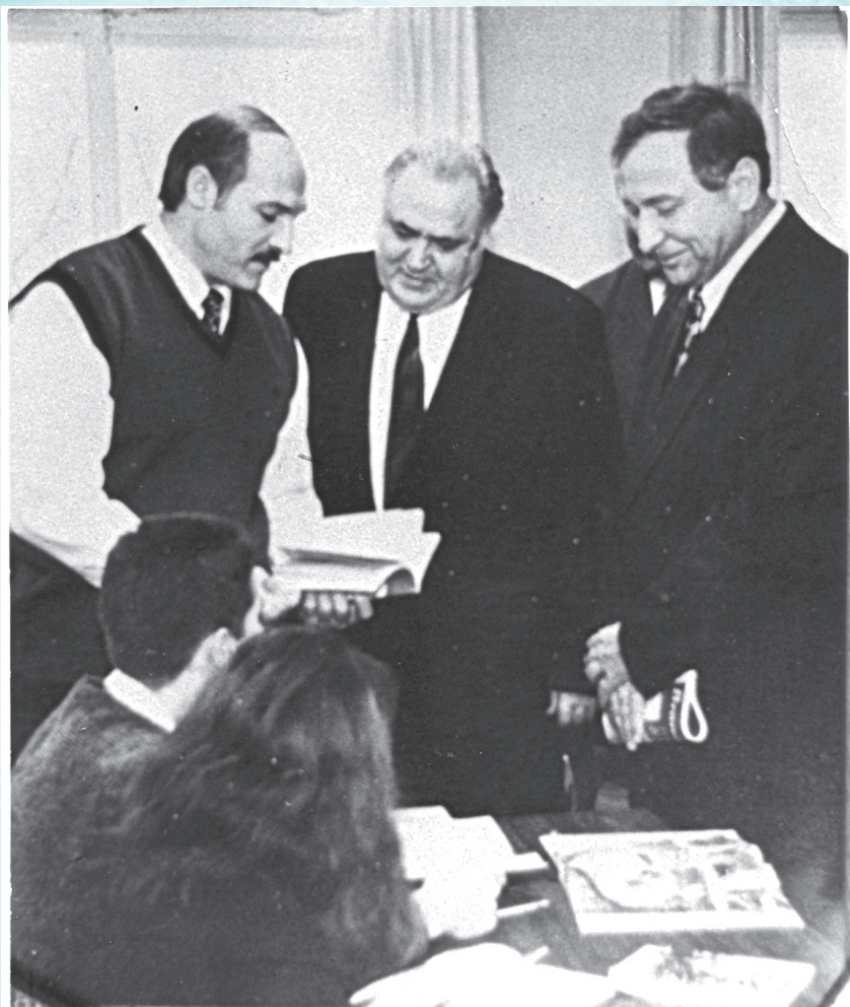
Визит Президента Республики Беларусь А.Г. Лукашенко в ГСХИ (11.12.1999 г.)