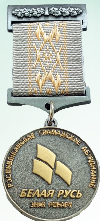
Знак Почёта РОО «Белая Русь»