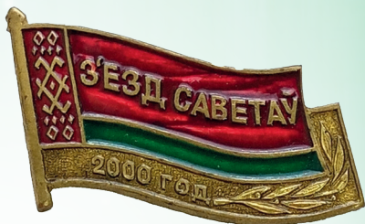
Нагрудный знак делегата Съезда Советов 2000 года