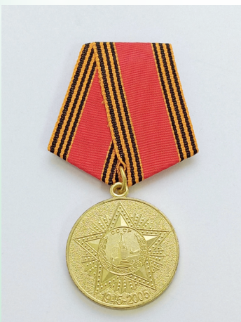
Медаль «60 лет Победы в Великой Отечественной войне»