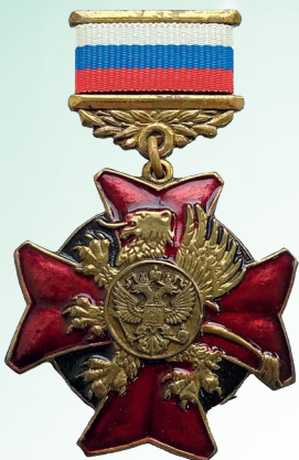
Орден «Крылатого льва» Европейской Ассоциации научных институтов