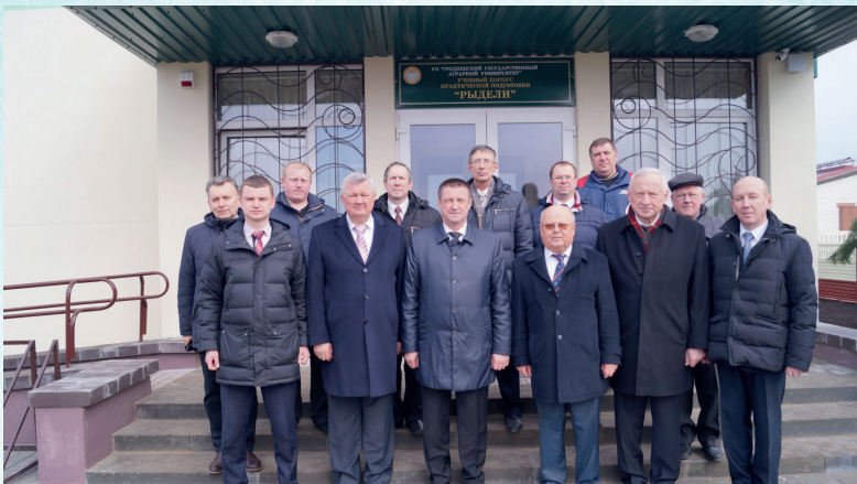
Коллективное фото в Центре практической подготовки на МТК «Рыдели» СПК «Прогресс Вертелишки» Гродненского района