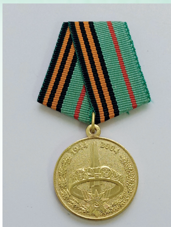
«60 лет освобождения Республики Беларусь от немецко-фашистских захватчиков»