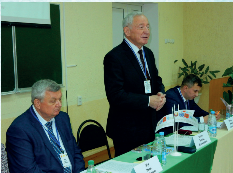
Открытие учебного Центра Гродненского Агропромышленного парка в УО «ГТАУ» (2019 г.)