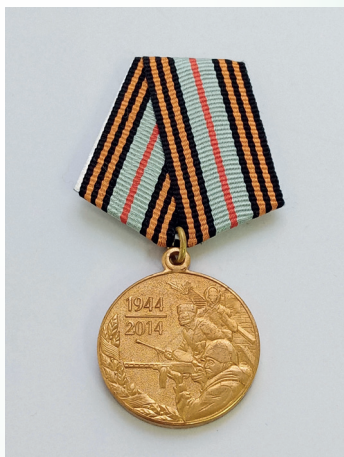
«70 лет освобождения Республики Беларусь от немецко-фашистских захватчиков»