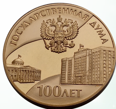
Наградная медаль «100 лет Государственной Думы России»