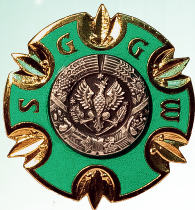
Почётный знак Варшавского университета естественных наук «За заслуги»