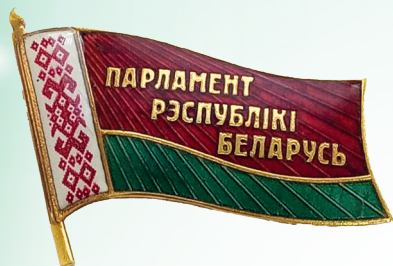
Нагрудный знак члена Парламента Республики Беларусь