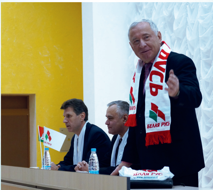
Выступление на слёте выпускников ВУЗов и ССУЗов Гродненской области (2016 г.)