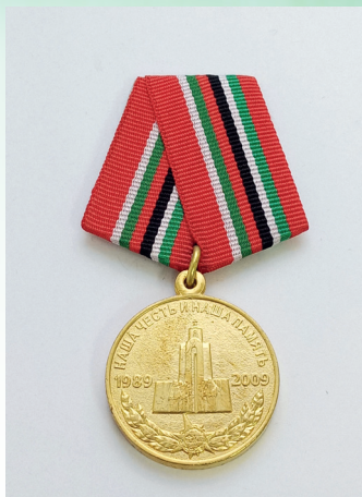
Медаль «20 лет вывода Советских войск из Афганистана»