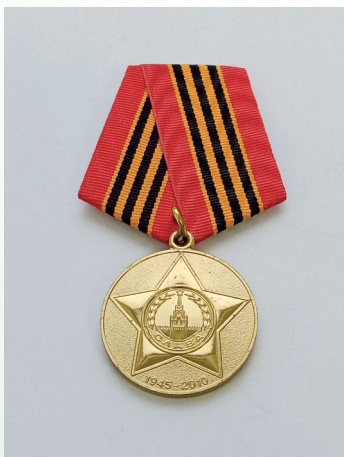
Медаль «65 лет Победы в Великой Отечественной войне»