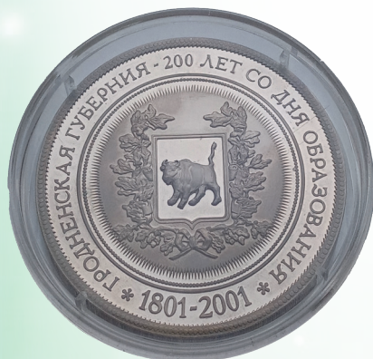
Наградная медаль «200 лет Гродненской губернии»