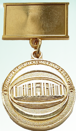
Нагрудный знак НАН Беларуси