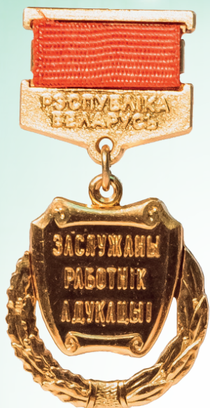
Заслуженный работник образования