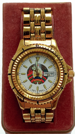
Наградные часы В.К Пестису от Президента Республики Беларусь