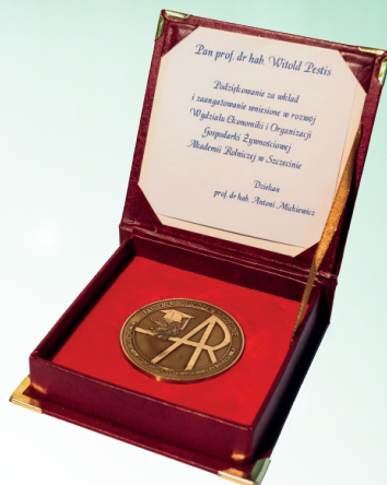
За вклад в развитие уни- верситета г. Щецин (Польша)