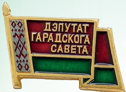
Нагрудный знак депутата Гродненского городского Совета