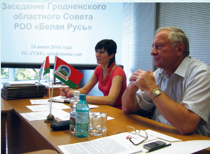
В президиуме Совета ГОО РОО «Белая Русь»