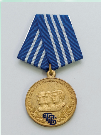
Медаль «100 лет профсоюзному движению Беларуси»