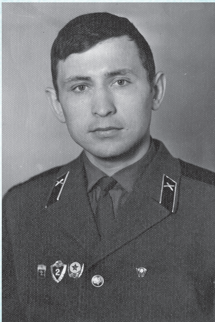
Служба в рядах Советской Армии (1971 г.)