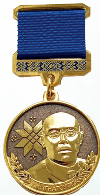
Нагрудный знак отличия «имени В.М. Игнатовского НАН Беларуси»