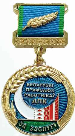
Нагрудный знак «За заслуги» Белорусского профсоюза работников АПК