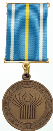
Нагрудный знак «20 лет Межпарламентской Ассамблеи стран- участников СНГ»