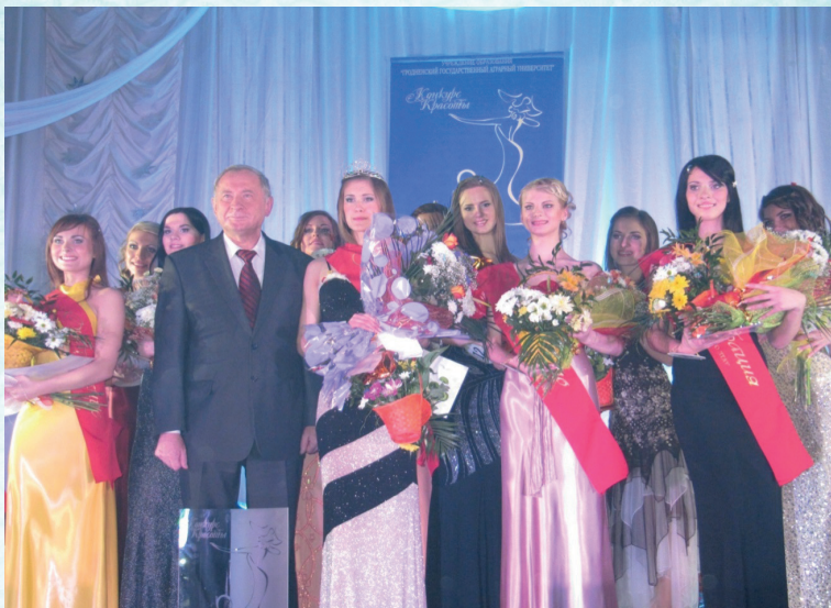
Чествование лауреатов конкурса «Мисс университет» в УО «ГГАУ»