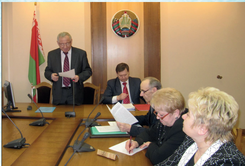
Заседание президиума Совета ГОО РОО «Белая Русь»