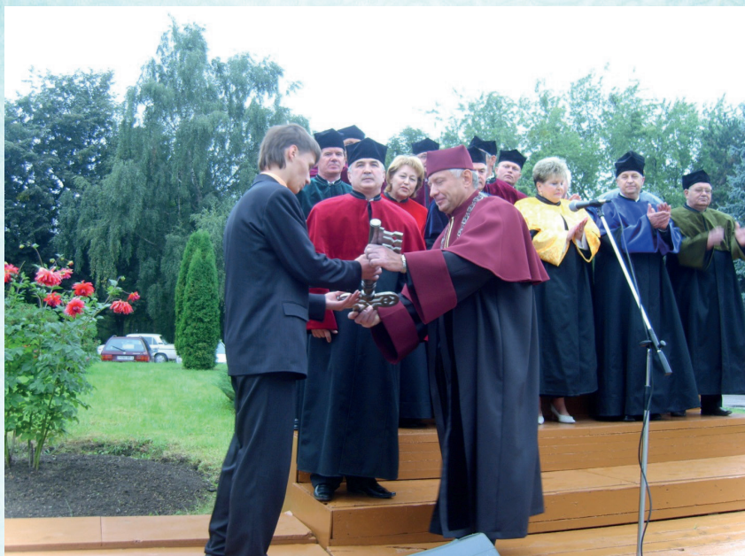
Начало учебного года