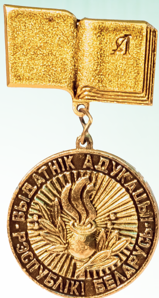
Отличник образования Республики Беларусь