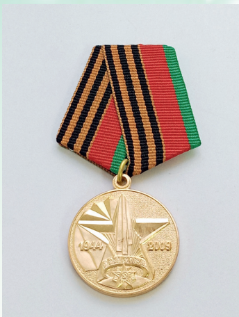
«65 лет освобождения Республики Беларусь от немецко-фашистских захватчиков»