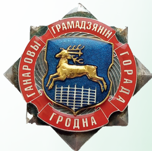
В.К Пестис – Почётный гражданин г. Гродно