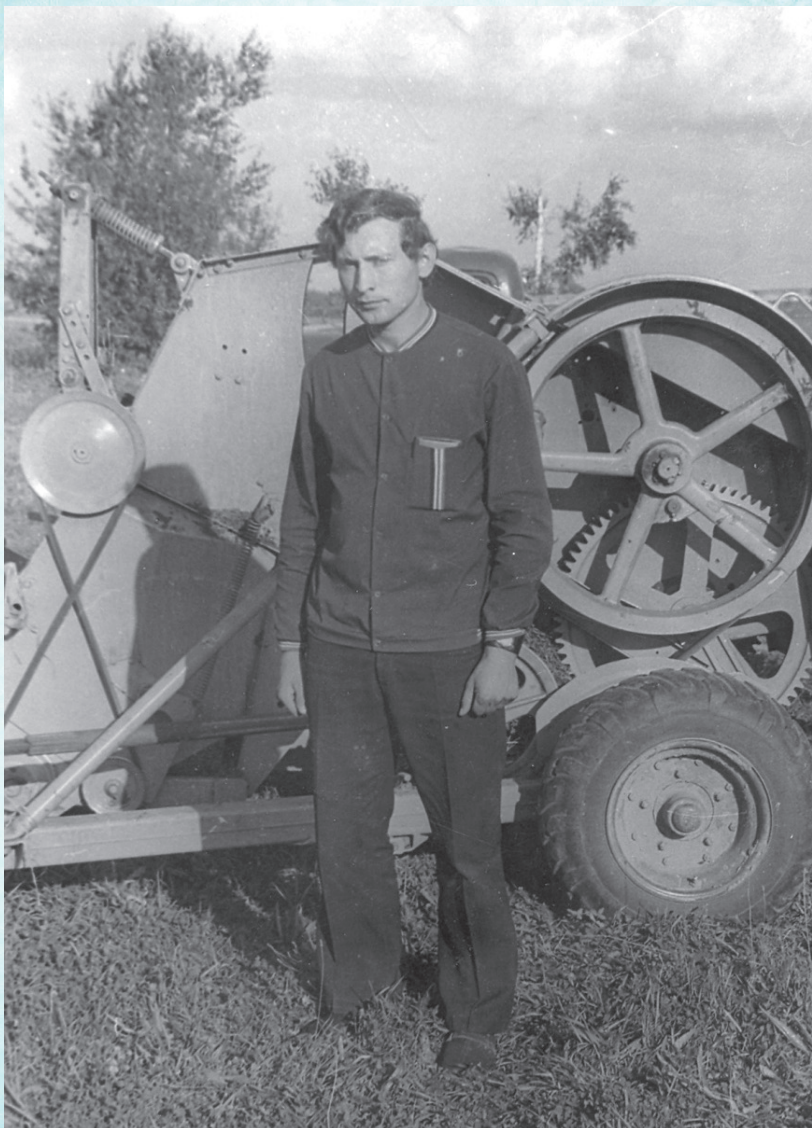
Главный зоотехник колхоза «Знамя коммунизма» Гродненского района (1975 г.)