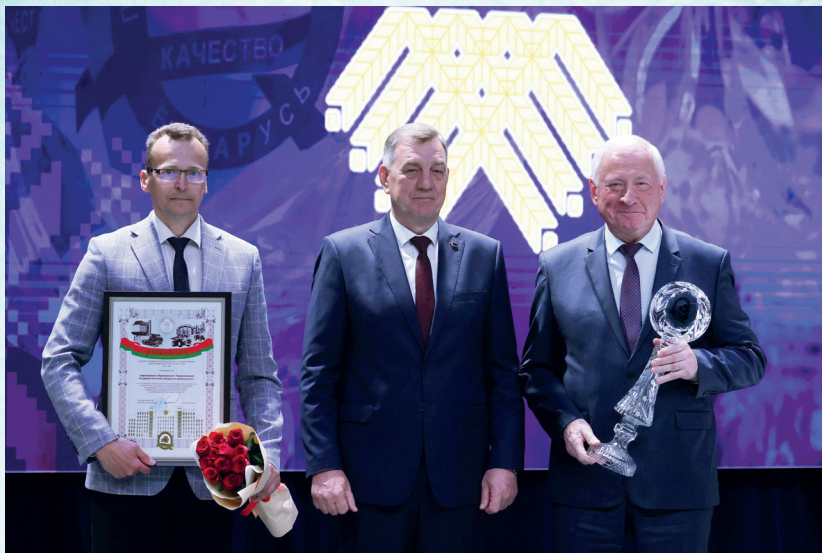
УО «ГГАУ» – Лауреат премии Правительства Республики Беларусь в области качества за 2021 год