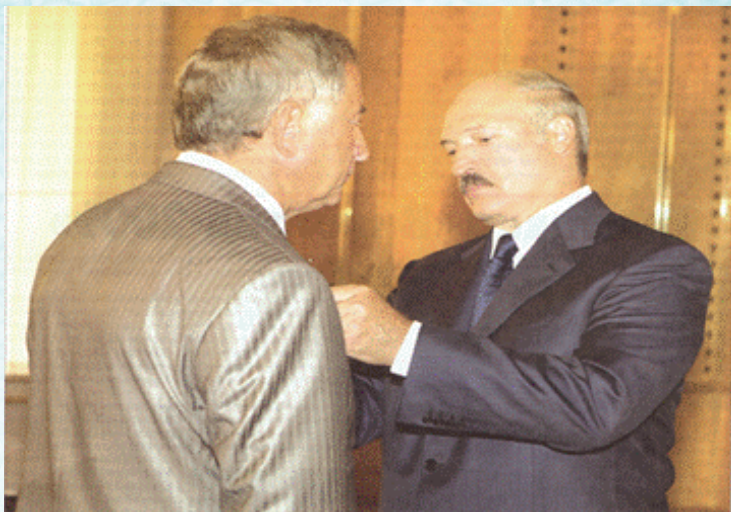
Награждение медалью Франциска Скорины (2009 г.)