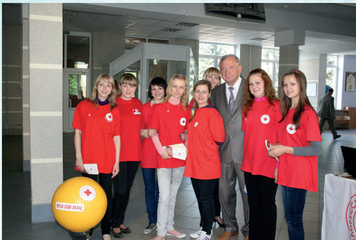
С активистами факультета защиты растений УО «ГГАУ» Общества Красного креста (2012 г.)