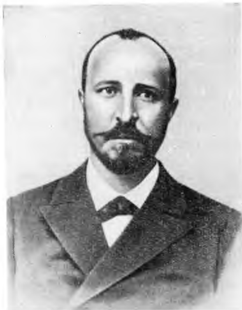
В. Р. Вильямс

хозяйстве, его недостатках и мерах к его усовершенствованию (1857—1882 гг.)». В этот сборник, кроме четырех прежних статей, он включил статьи об обеспечении кормовыми средствами скота в средней черноземной полосе России и статью о значении величины хозяйственной единицы. В 80-х годах Стебут выпустил также вторым изданием «Основы полевой культуры» и «Учебник частного растениеводства, вып. 1. Введение и паровой клин в пару». В процессе работы над учебником он в 1885 г. посетил Казанское, Мариинское (в Саратовской губернии), Горыгорецкое и Харьковское земледельческие училища и, конечно, Московскую земледельческую школу. Эти училища благодаря своей успешной деятельности особенно выделялись среди восьми учебных ферм, открытых в период с 1841 по 1848 г.