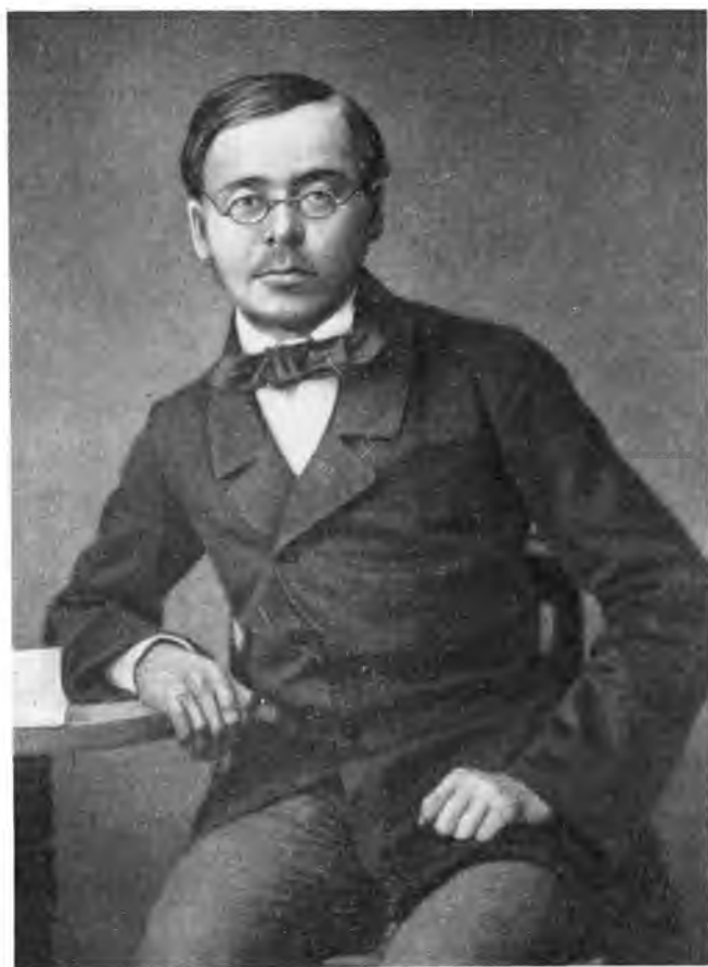
И. А. Стебут после окончания Горыгорецкого института