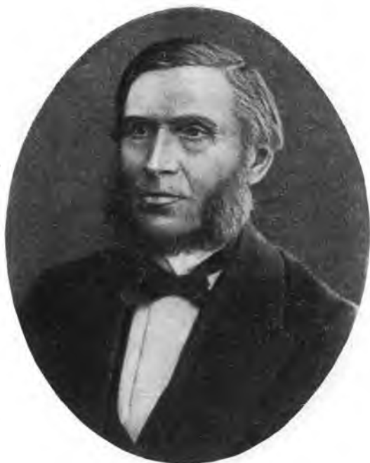
Б. А. Михельсон

Московская земледельческая школа с Бутырским хутором в Москве (с 1822 г.); Школа земледелия, сельского хозяйства и горнозаводских наук в Петербурге с учебным хозяйством в Новгородской губернии (1825—1849); практическое земледельческое училище в Гатчине (1844—1849); Альткустгофское практическое учебное заведение сельского хозяйства близ Дерпта (1834—1839); школа проф. М. Г. Павлова под Москвой (1840). В 1840—1862 гг. близ Варшавы существовал Маримонтский институт сельского хозяйства и лесоводства.