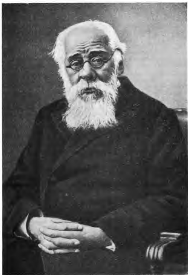
И. А. Стебут в последние годы жизни