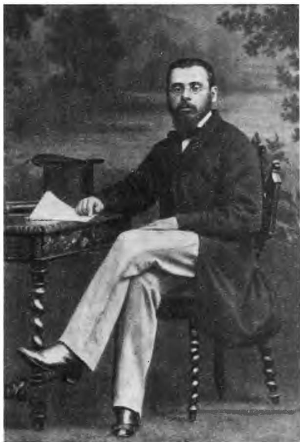
И. А. Стебут в Париже. 1860 г.