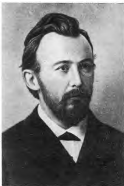
Д. Н. Прянишников

на сложные требования, которые предъявляются к агроному: он должен быть хорошим экономистом и администратором и получить не только агрономическое образование, но и агрономическое воспитание, на чем Стебут особенно настаивал. По его мнению, агроному предстоит тяжелый труд: он должен рано вставать, иногда не досыпать, развить у себя наблюдательность к явлениям природы, быть упорным в борьбе со стихийными явлениями природы и пр. Поэтому тем, кто не чувствует себя склонным к этим условиям, он советовал своевременно избрать другую деятельность. Стебут предостерегал от взгляда на сельское хозяйство как на идиллию.