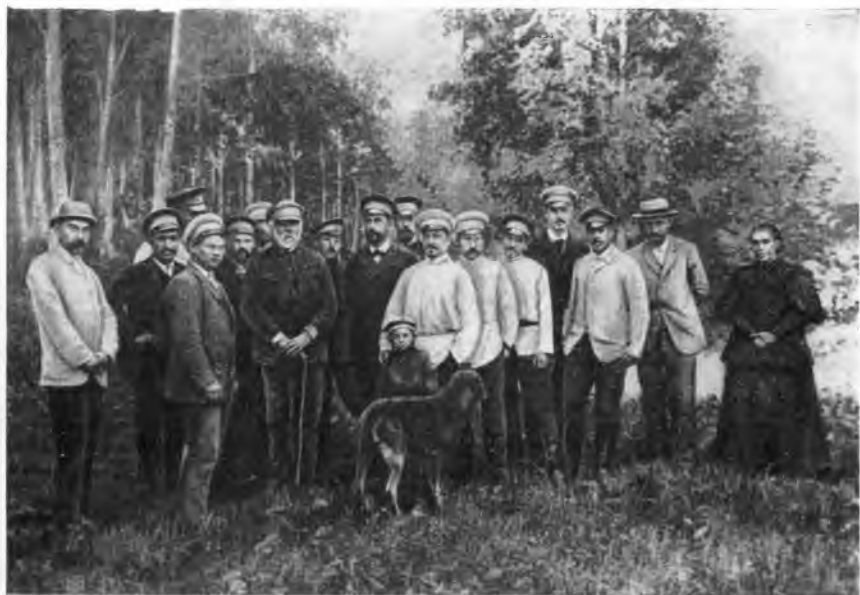
На экскурсии в Кротком. 1896 г.

решало бы задачу улучшения обработки почвы. А это требовало увеличения количества кормов, т. е. надо было начать возделывание кормовых культур.