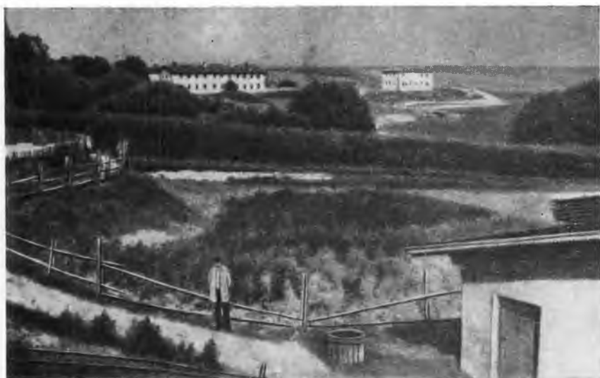
В Горыгорецком институте. 50-е годы

На лето 1856 г. министерство государственных имуществ командировало меня в остзейские (прибалтийские) губернии для ближайшего изучения лучших хозяйств этого края. В этом путешествии я пробыл с 7 мая по 15 августа и вынес из него массу полезных сведений. Об этом агрономическом путешествии я представил отчет, мой первый сколько-нибудь значительный печатный труд, который был удостоен серебряной медали Ученым комитетом министерства и был напечатан в Журнале министерства государственных имуществ в 1857 г.».