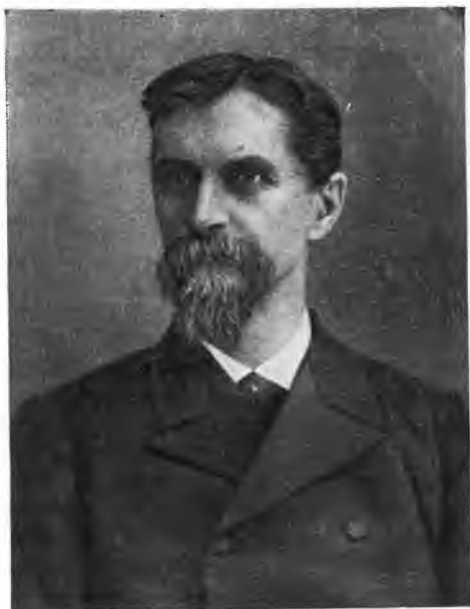
К. А. Тимирязев